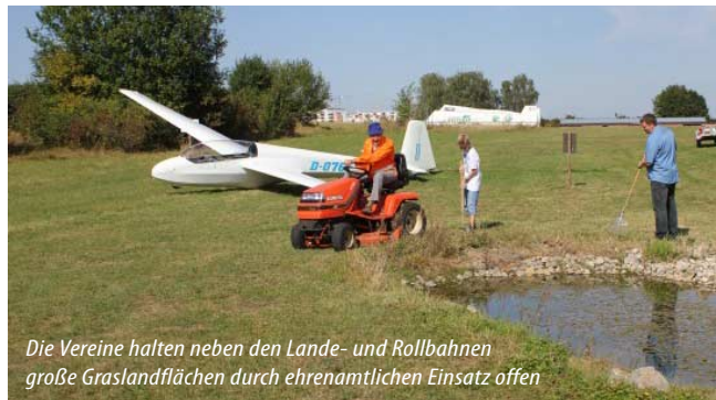
Die Vereine halten neben den Lande- und Rollbahnen große Graslandflächen durch ehrenamtlichen Einsatz offen